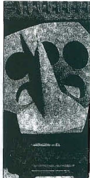
Kegel - Gips, Pappe (1991) - von Erika Stürmer-Alex. Für sie ist das Experimentieren mit Alltags- und Abfallmaterial neben der Malerei zum wichtigster Ausdrucksmittel geworden.