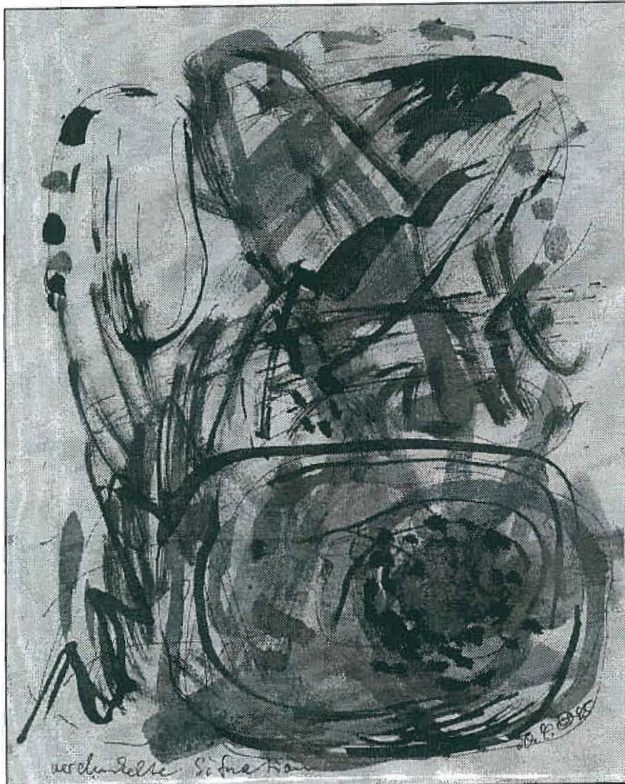
Elke Postler, Tusche, 1995

Zur Eröffnung der Ausstellung am Sonntag, dem 27. August, um 14.30 Uhr, laden wir Sie und Ihre Freunde herzlich ein.