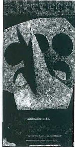
Kegel - Gips, Pappe (1991) - von Erika Stürmer-Alex. Für sie ist das Experimentieren mit Alltags- und Abfallmaterial neben der Malerei zum wichtigster Ausdrucksmittel geworden.