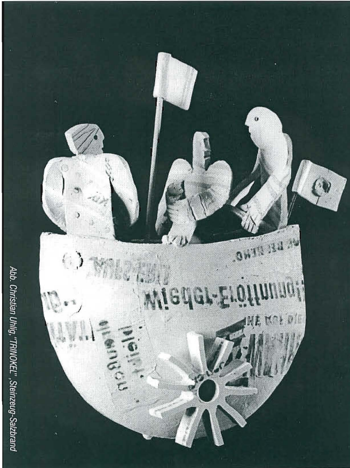
Abb. Christian Uhlig, "TRINOKEL", Steinzeug-Salzbrand

16259 Altranft / Schloß Tel.: 03344 / 41 43 19 Fax: 03344 / 41 43 25